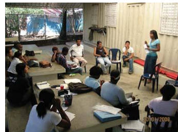
Sesiones de capacitación (Rep. Dominicana)