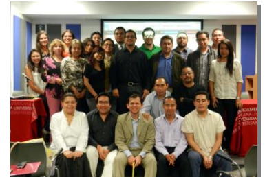
Jornadas de inicio (México - CM)