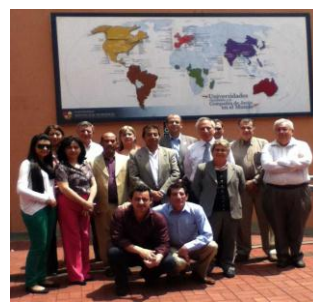
Reunión Anual de Coordinadores del Diplomado