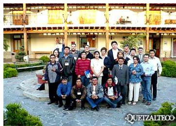
Jornadas de inicio (Guatemala)